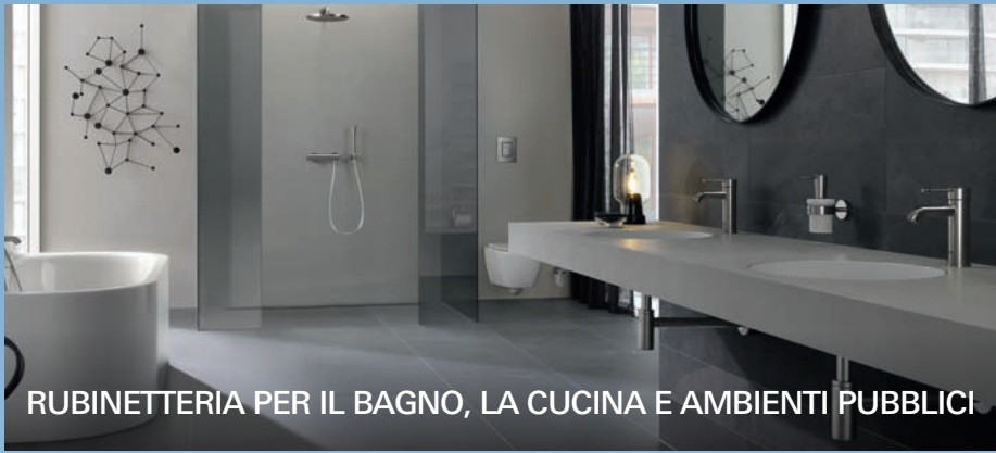
RUBINETTERIA PER IL BAGNO, LA CUCINA E AMBIENTI PUBBLICI