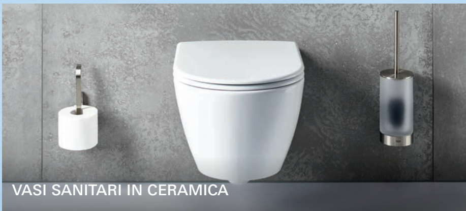
VASI SANITARI IN CERAMICA