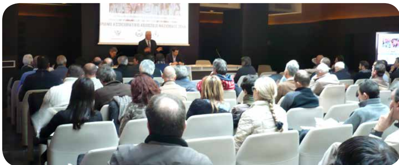
Presentazione Piano Assicurativo Agricolo Nazionale

1 - Nel contratto assicurativo deve essere, tra l'altro riportato, per ogni garanzia e bene assicurato, il valore assicurato, la tariffa applicata, l'importo del premio, la soglia di danno e/o la franchigia e la presenza di polizze integrative non agevolate legate al medesimo bene oggetto di assicurazione agevolata; inoltre, al fine di agevolare le attività di gestione, monitoraggio e controllo del contributo di cui al successivo art. 5, le eventuali coperture integrative non agevolate, legate al medesimo bene oggetto di assicurazione agevolata, devono riportare il medesimo contraente delle coperture agevolate (cioè CONDIFESA).