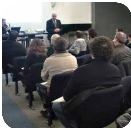
Incontro a ALBA