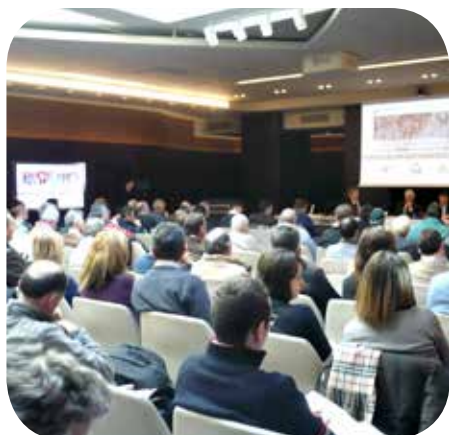
Incontro a CUNEO