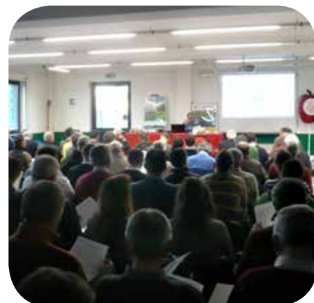
Incontro a LAGNASCO