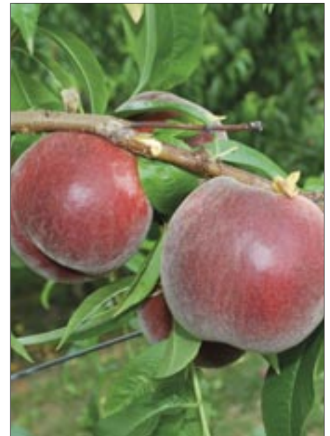
Nabby ® ZAI 674

Di pari epoca matura la cultivar Nabby ® ZAI 674* . Il frutto è di forma