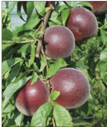
Ophelia® ZAI 685*

molto attraente. La produttività è media. Soddisfacenti la consistenza della polpa e la tenuta in pianta che andrebbe verificata in pieno campo. Buono il sapore, dolce e aromatico. Dieci giorni dopo segnaliamo Octavia® Zaigle* , cultivar avviata alla sperimentazione estesa. L'albero è di medio vigore. Il frutto è di grossa pezzatura. La forma è oblata-rotonda,